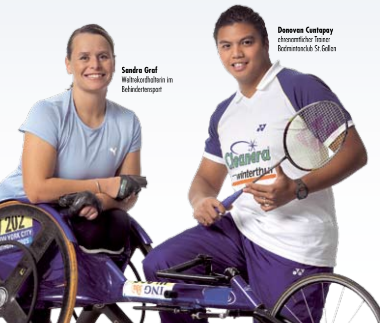
Sandra Graf Weltrekordhalterin im Behindertensport

Sportorganisationen mit Qualitätslabel profitieren im Alltag in ihrer Vereinsarbeit von den konkreten Hilfestellungen von «Sport-verein-t» und werden zudem mit höheren «Sport-Toto»-Subventionen belohnt. Bereits anerkennen zahlreiche St.Gallische Stadt- und Gemeindebehörden das Gütesiegel und honorieren die damit verbundenen ehrenamtlichen Zusatzaktivitäten, welche zum Wohle der Gesamtbevölkerung erbracht werden. «Sport-verein-t» wird von allen 40 Mitgliedsverbänden der IG St.Galler Sportverbände mitgetragen.