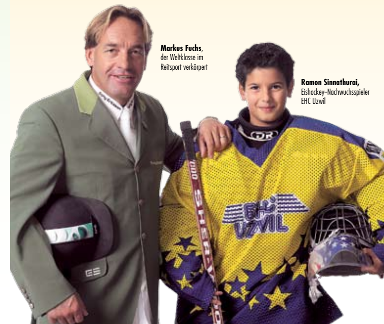
Markus Fuchs, der Weltklasse im Reitsport verkörpert